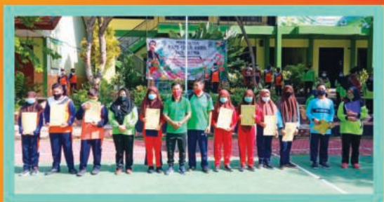
▲ Lomba Kebersihan dan keindahan Kelas