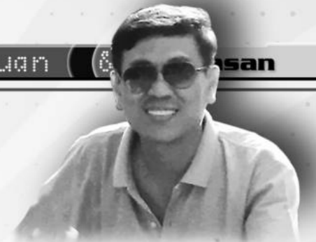
Oleh : Warjito, S.Pd. *)

Sudah kewajiban Bapak Ibu Guru untuk mengajar atau mengasah otak ( Intelegensi Quotion / IQ) siswa sehingga yang tadinya tidak bisa menjadi bisa.