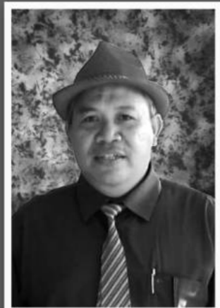
Oleh: H. Ja'far Shodiq, S.ag. *)