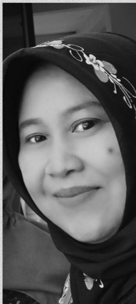
Oleh : Rochmatin S.Pd., MM.