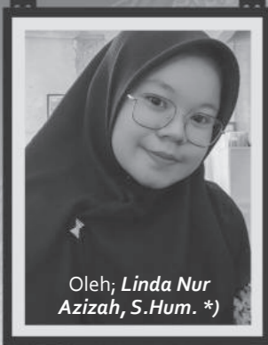
Oleh: Linda Nur Azizah, S.Hum. *