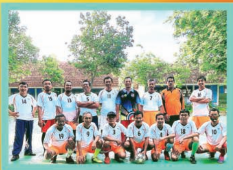
▲ Futsal Jumat Pagi