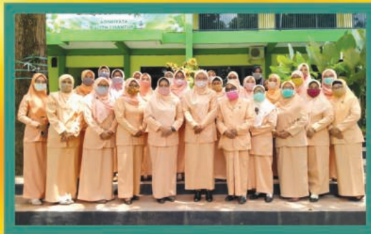
◀ Darma wanita 2020