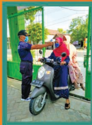
◀ Cek suhu tubuh, penerapan protokol kesehatan di era new normal