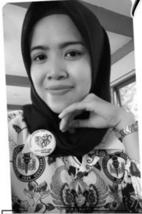
Oleh: Erni Yuliatin, S.Pd. *)

Saat ini sudah banyak kalangan anak muda yang sukses dalam dunia bisnis. Banyak dari mereka yang lebih memilih berbisnis daripada menjadi karyawan, apalagi kalangan anak muda zaman milenial sekarang cenderung lebih mudah bosan dalam bekerja. Selain bosan, alasan lain yang membuat mereka lebih memilih berbisnis adalah waktu yang tidak terikat, bisa dilakukan di mana saja, dan memberi penghasilan yang tidak terbatas.