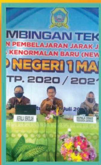
▲ BIMTEK PJJ