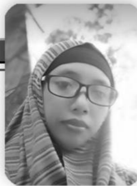
Oleh: Wulandari Eka Sukma, S.Kom.*)