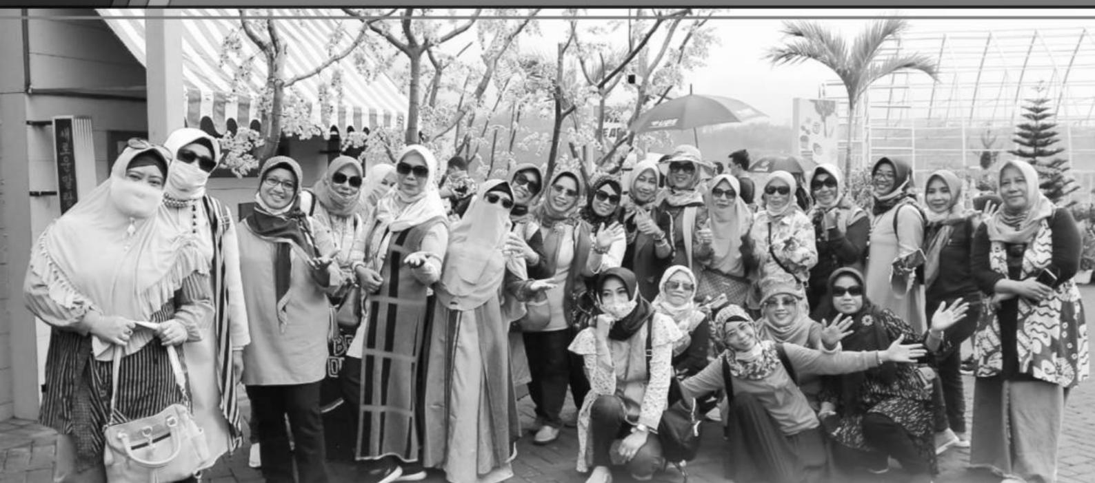
Gathering Bersama Ibu-Ibu Dharma Wanita Diknas Kabupaten Lamongan: